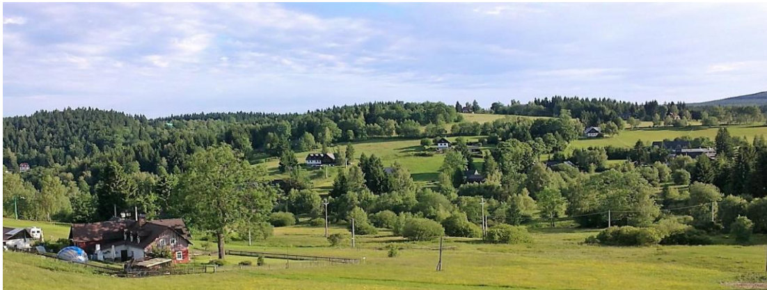
Každá lokalita je jiná....

Výběr vhodného řešení podstatně ovlivňuje náklady a následně stočné, nebo přímo náklady obyvatel. Nejlepší řešení je obvykle založené na akceptaci místních podmínek a k zpracování a vyhodnocení variantních řešení je proto vhodné přistoupit z hlediska udržitelnosti tj. zohledněním – ekonomických, ekologických a sociálních parametrů – případně začleněním dalších aspektů do hodnocení, jako je např. odolnost řešení.