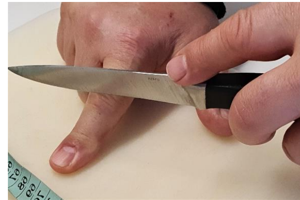
2X měř ....